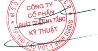
ĐỖ QUANG NGÔN